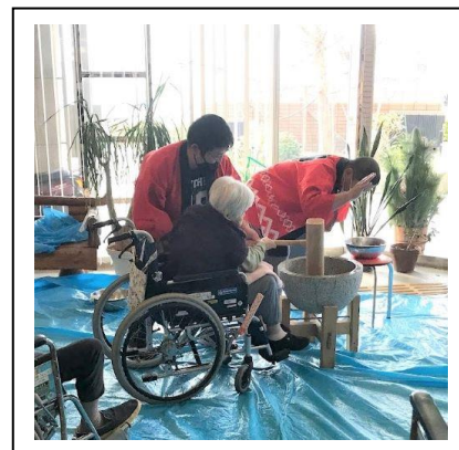
12.27 もちつき大会(星陵)