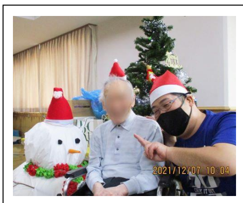
12.7 クリスマス会(星陵)