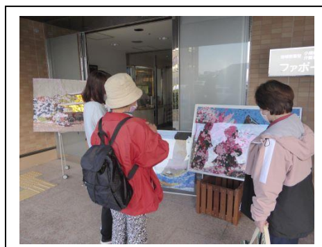
3.8 巨大貼り絵の展示(泉が丘)