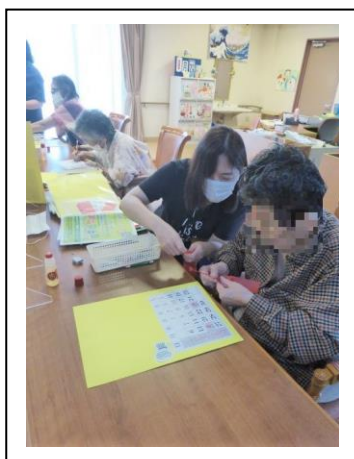
8.23 カレンダー作り(泉が丘)