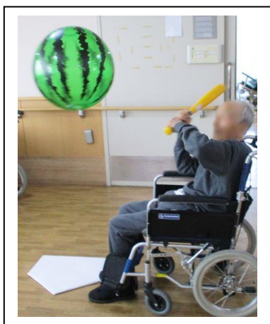
4.30 ベースボール大会(星陵)