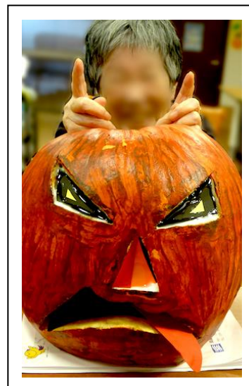
10.31 ハロウィン(泉が丘)